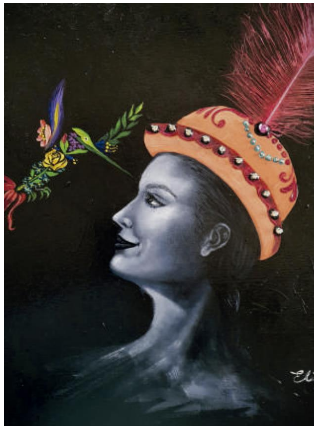
Morenada – Óleo sobre lienzo