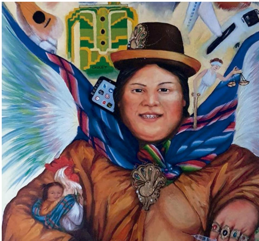
La Ekeka – Óleo sobre lienzo