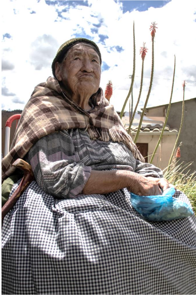
Matriarca aymara – Fotografía impresa en papel Platine Fibre, 40x60cm