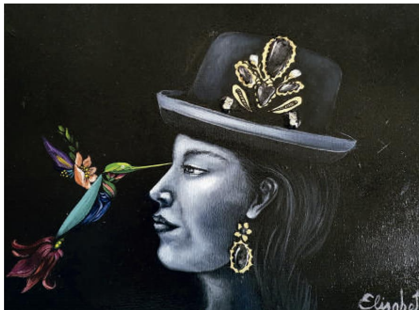
La Chola – Óleo sobre lienzo