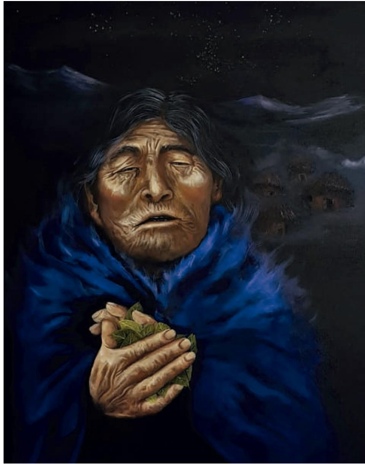
Mama coca – Óleo sobre lienzo