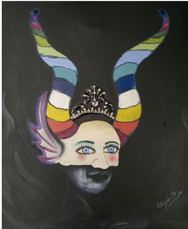
La Diabla – Óleo sobre lienzo