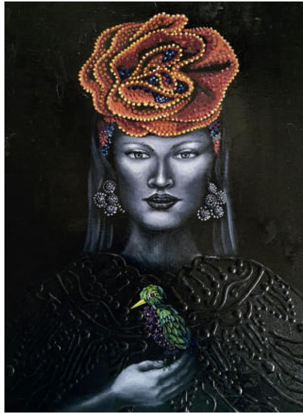
Rosita – Óleo sobre lienzo