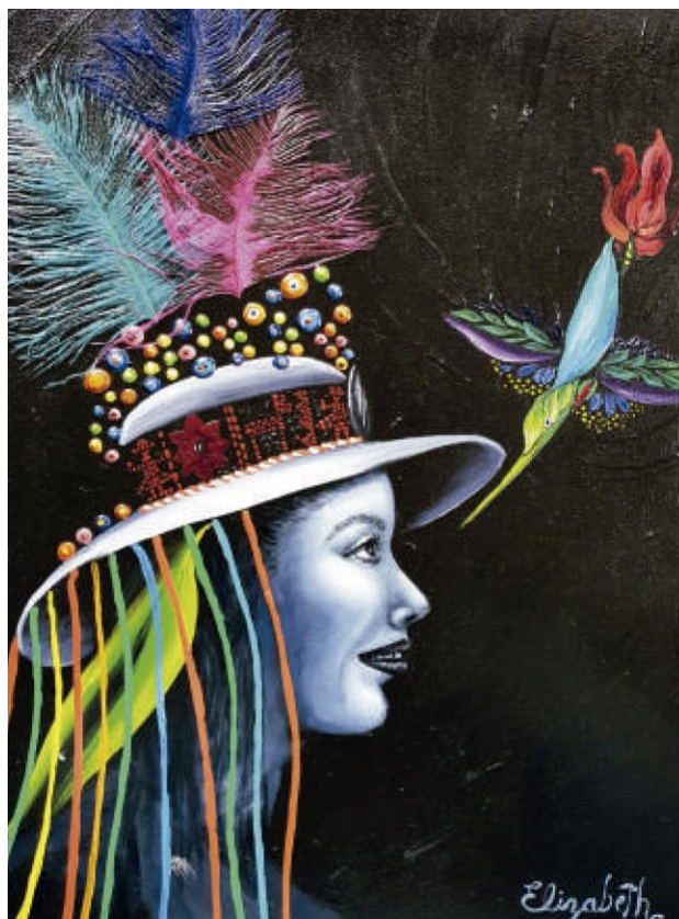
Tinku – Óleo sobre lienzo,