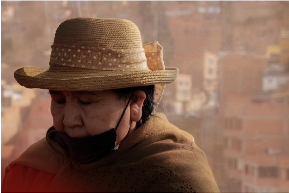
Serie: Rojo, marrón y dorado – Fotografía impresa en papel Platine Fibre, 40x60cm