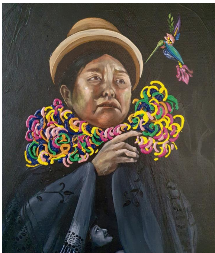
Basilia Katari – Óleo sobre lienzo, 60x40 cm