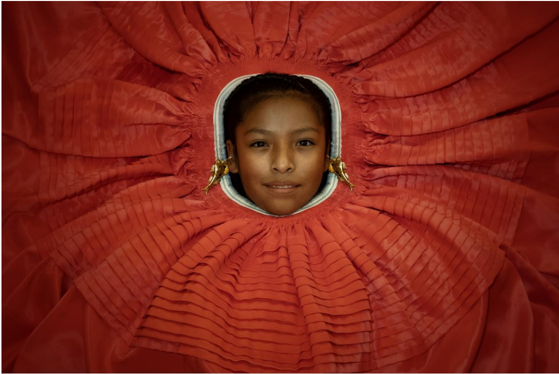
Serie: Rojo, marrón y dorado – Fotografía impresa en papel Platine Fibre, 40x60cm