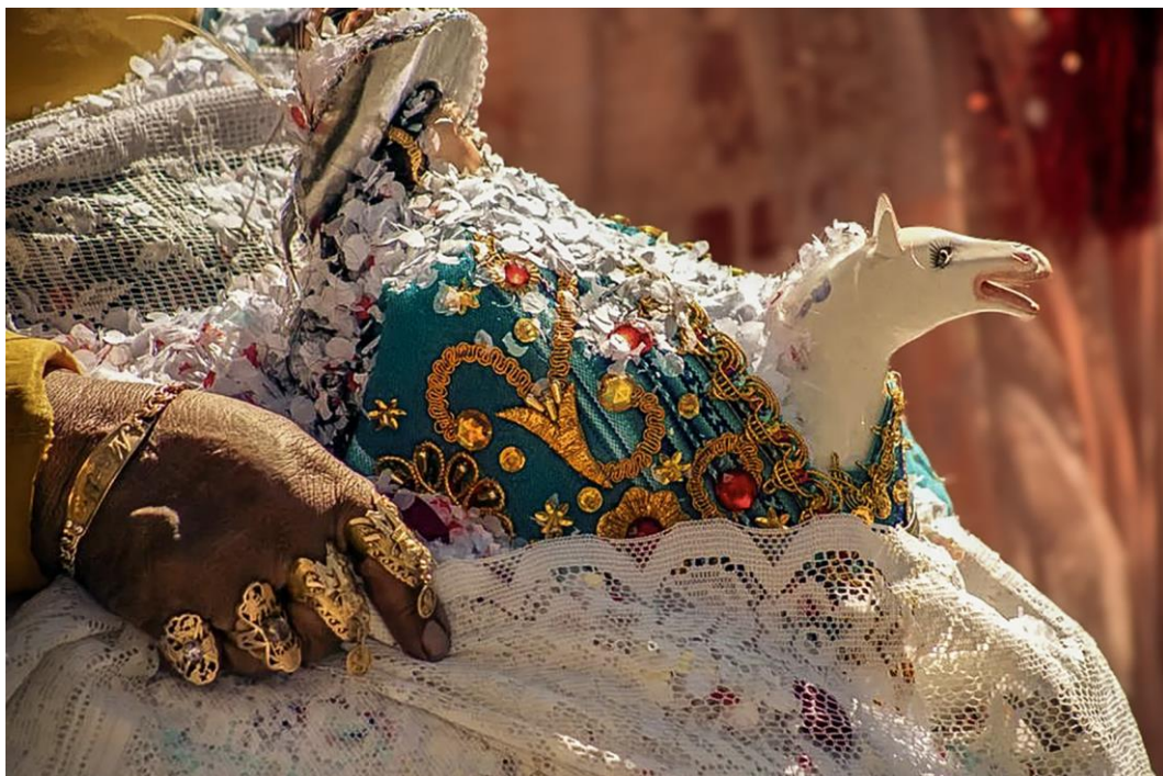
Serie: Rojo, marrón y dorado – Fotografía impresa en papel Platine Fibre, 40x60cm