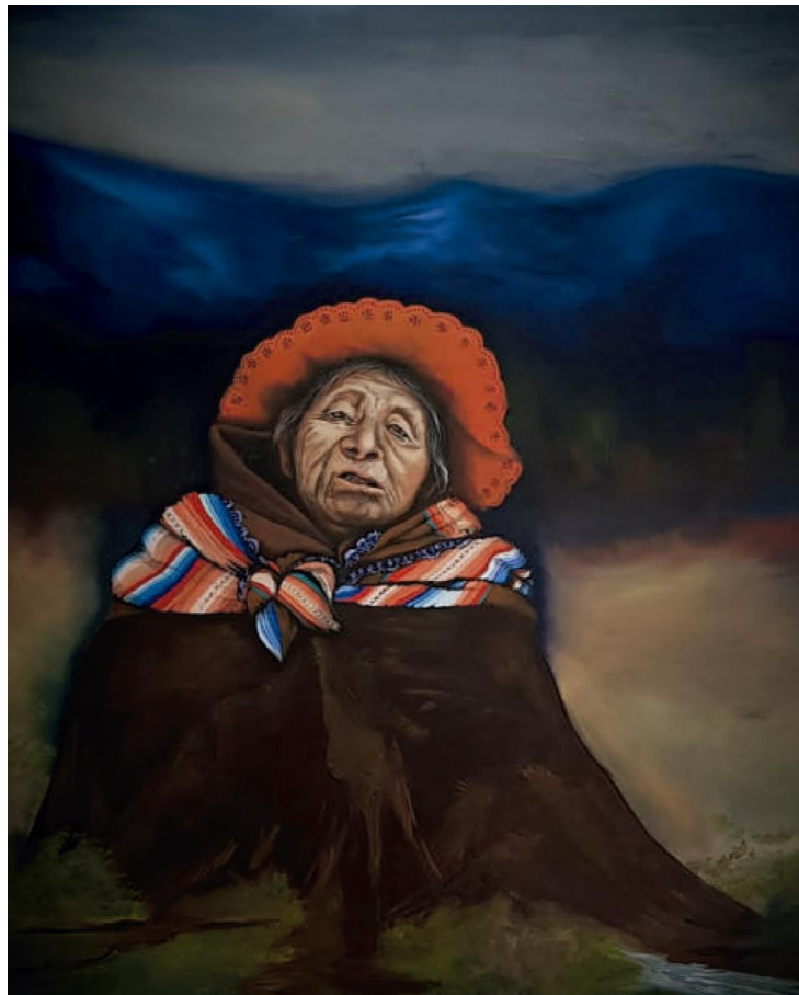
Pacha – Óleo sobre lienzo