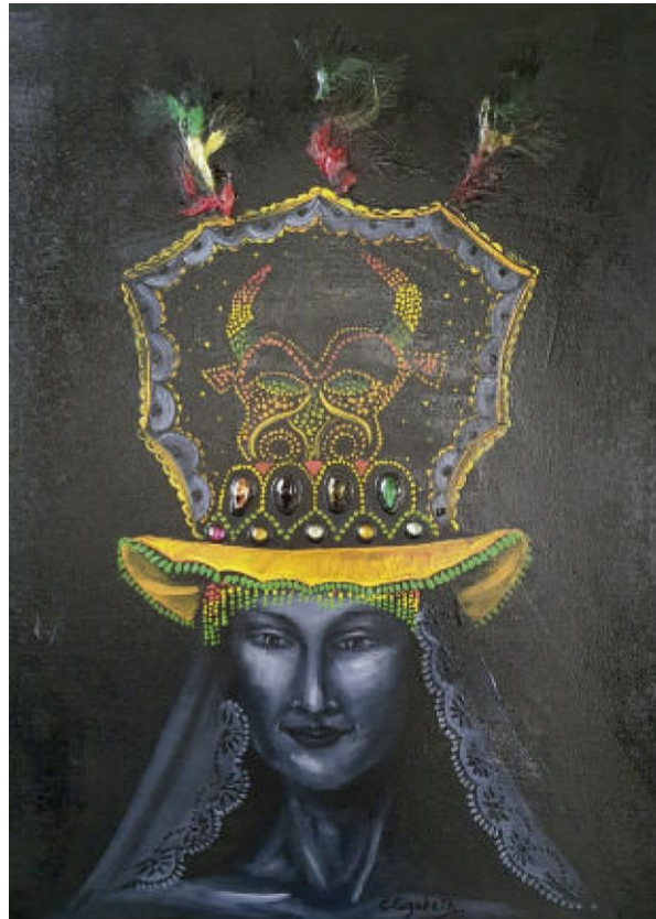
Waca waca – Óleo sobre lienzo,