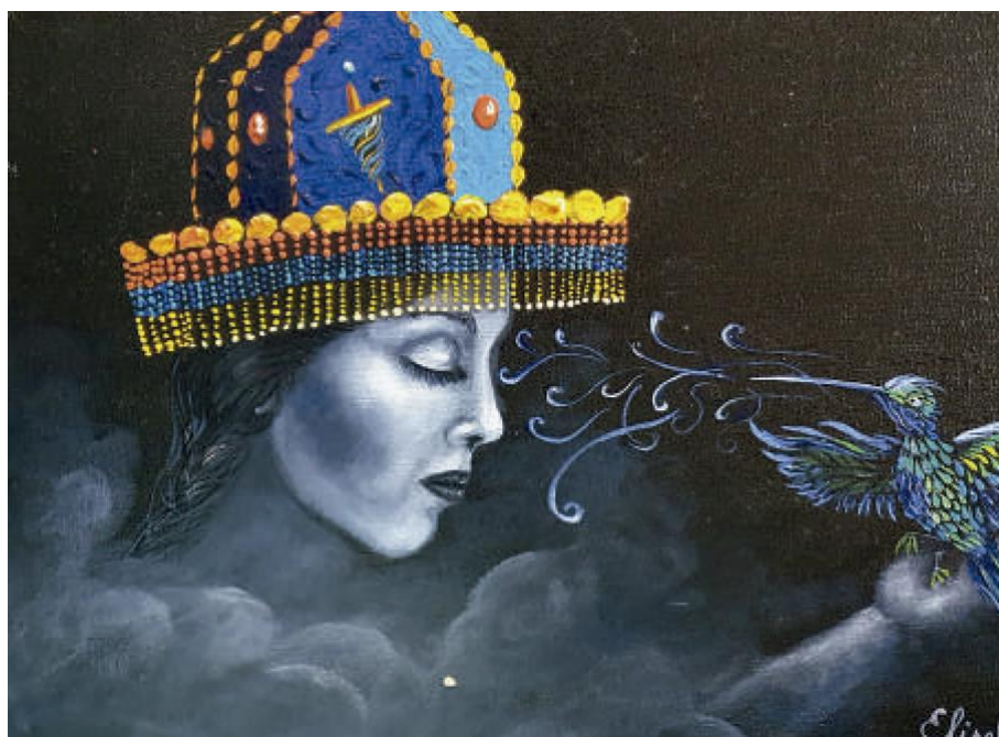
La Kullawa – Óleo sobre lienzo