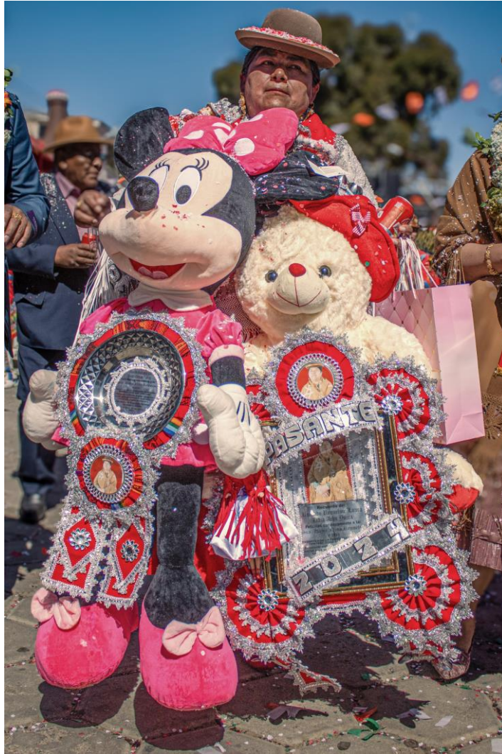
Serie: Preste – Fotografía impresa en papel Platine Fibre, 40x60cm