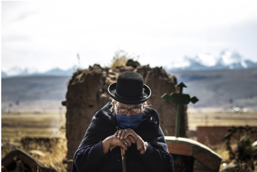
Isolda se eleva – Fotografía impresa en papel Platine Fibre, 40x60cm