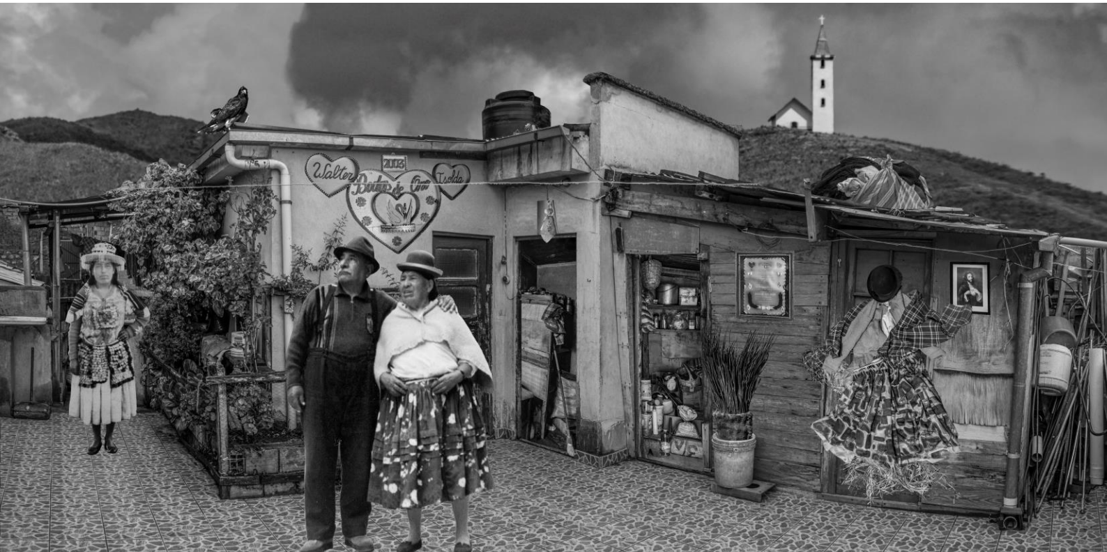
La cumbra de Isolda – Instalación fotográfica - collage impresa en papel Platine Fibre, 110x120cm